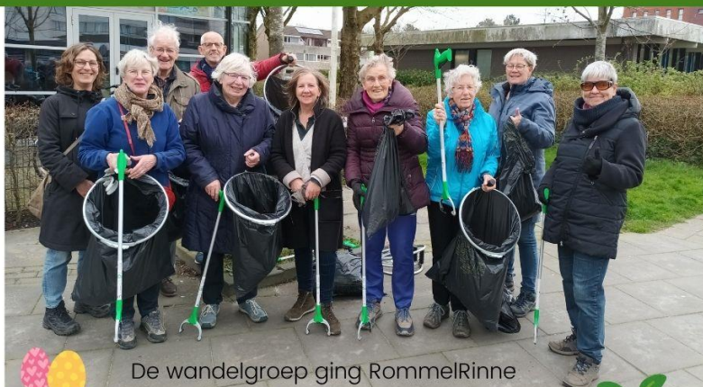
De wandelgroep ging RommelRinne