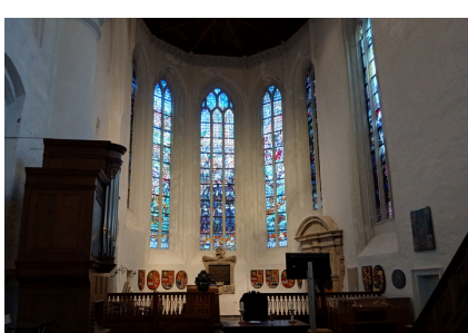
Palmpasen, paasontbijt, Dolorosa